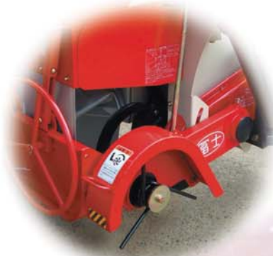
畦上面削り装置 (標準装備)